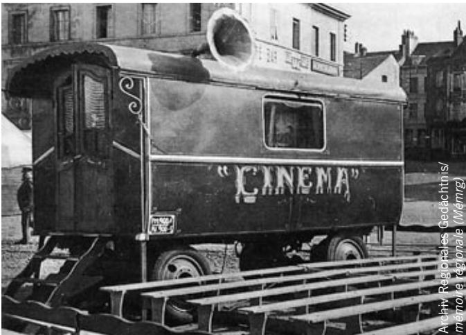
Aus den Anfängen der Kinematographie: Der Cinema-Wagen auf dem Zentralplatz in Biel, um 1900.

Dass die erste Juragewässerskorrektur bloss eine Zwischenstation war, die erhebliche weitere Überschwemmungen des Seelandes nicht verhindern konnte, zeigt ein nächster Abschnitt, der sich mit den weiteren Korrekturen, namentlich der Zweiten Juragewässerskorrektur, befasst.