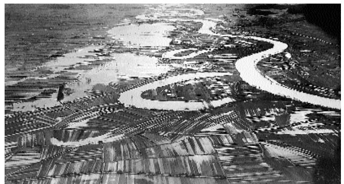
Beim Hochwasser 1944 verliess die Aare unterhalb von Büren ihr Bett.