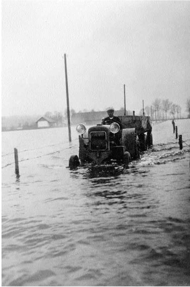
Die erste Juragewässerkorrektur löste noch nicht alle Probleme: Witzwil 1944.

Die Überschwemmungen trafen eine weitgehend wehrlose Bevölkerung: Haus und Herd – unter Umständen Leib und Leben – standen auf dem Spiel. Kein Versicherungsexperte schaute nach der Katastrophe vorbei, um den Schaden aufzunehmen. Auch die armen Seeländer Gemeinden waren kaum in der Lage, ihrer notleidenden Bevölkerung finanziell unter die Arme zu greifen.